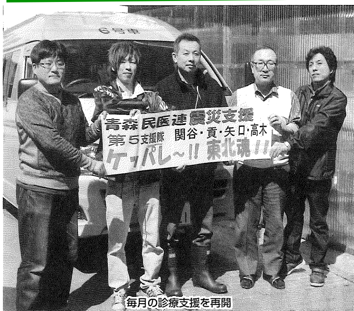
毎月診療支援を再開

4月25日、青森市にて東日本大震災における被災者の支援活動等に対する厚生労働大臣感謝状伝達式が行われました。受賞団体は全部で42団体、津軽保健生協からは健生病院と藤代健生病院が受賞となりました。